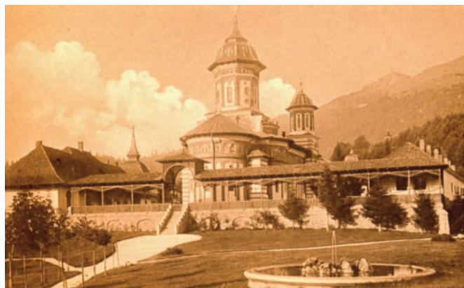
Mănăstirea în 1903, vedere dintre est, cu zidul din 1895 și cerdacul de lemn.