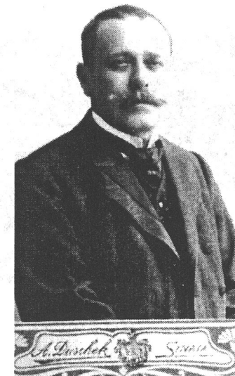
I.L. Caragiale, fotografiat la Sinaia