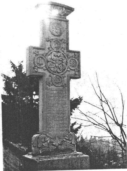
Crucea de pe locul unde a existat Schitul Sfântului Nicolae, de la Molomoș