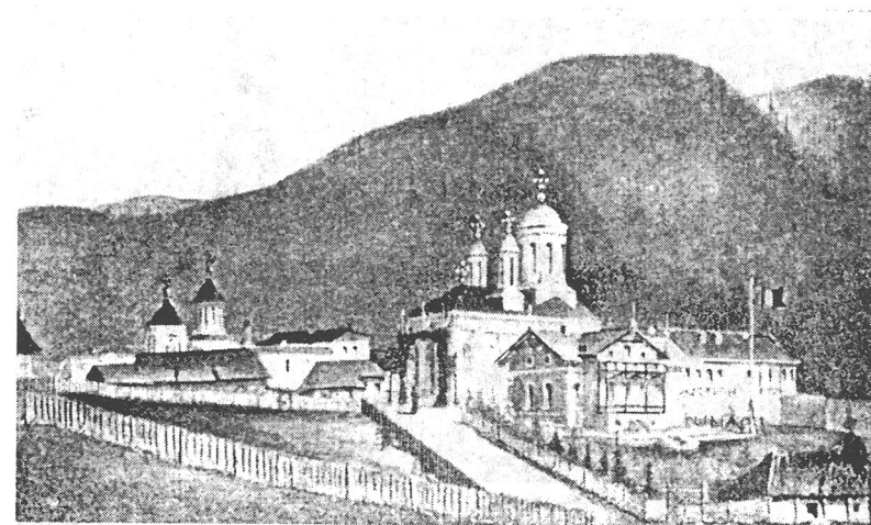
Vedere generală a Mănăstirii Sinaia