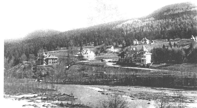
Sinaia nouă - Cumpătu (1924)

La 15 august 1995 a avut loc cinstirea celor trei secole de existență a Mănăstirii. În acea zi, la Mănăstire s-a desfășurat slujba cuvenită, celelalte manifestări aniversare având loc în luna octombrie 1995. În dimineața zilei de începere a manifestărilor amintite, în curtea vechii biserici a Mănăstirii a fost dezvelită o placă din bronz, fixată în peretele dinspre est, cu textul următor: „Pentru cinstirea și neuitarea Spătarului Mihai Cantacuzino, ziditorul acestei Sfinte Mănăstiri. 1695-1995. Locuitorii orașului Sinaia”.