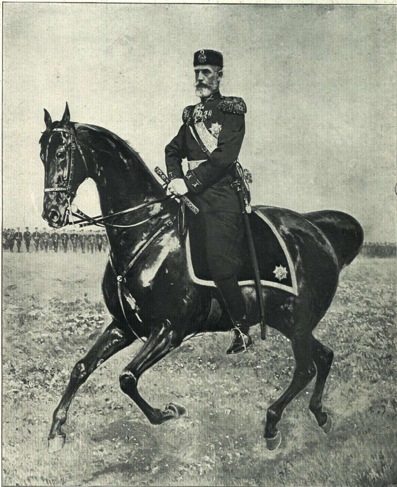
M. S. REGELE CAROL I AL ROMÂNIEI ÎN UNIFORMĂ DE FELD-MAREȘAL AL ARMATEI RUSEȘTI