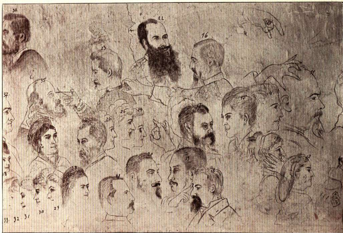
Desenurile M. S. Reginei pe zidurile Monastirei din Sinaia