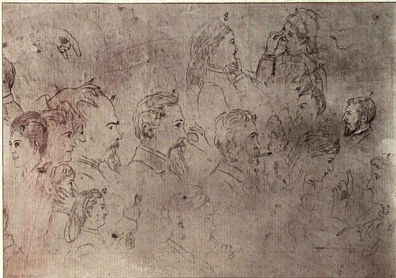
Desenurile M. S. Reginei pe zidurile Monastirei din Sinaia