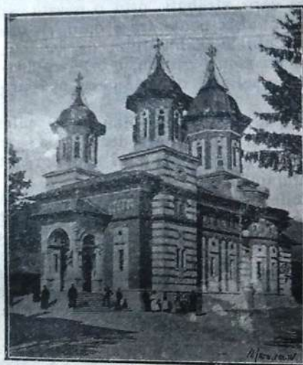
Monastirea Sinaia, recondiții în 1901—903

ce a suferit în cursul anilor, și formează un quadrilater, încongiurat de toate părțile cu ziduri groase, compus din biserica din mijloc, paraclis și chilii pentru călugări, toate cu ferestre mici ca de fortărețe, păstrind și acum aparințele mai mult ale unei cetăți, destinată a fi de pază contra tâlharilor și a năvălitorilor.